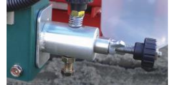
吐出目盛りを微調整/再設定可能