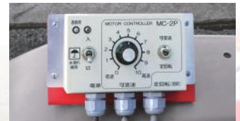
パルス式コントローラ