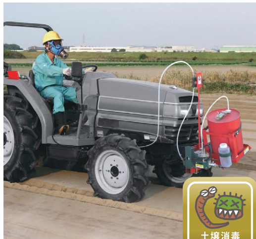
テフロンダイヤフラム採用