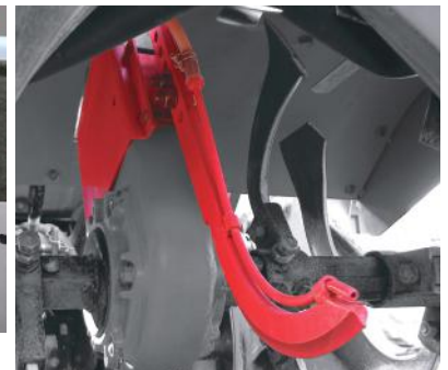
注入ツメ+液ダレ防止バルブ (ノズルはロータリチェーンケースに挟み込み)