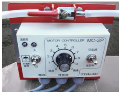
パルス式コントローラ+2方コック