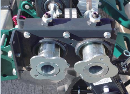
全条調整 ハンドル部