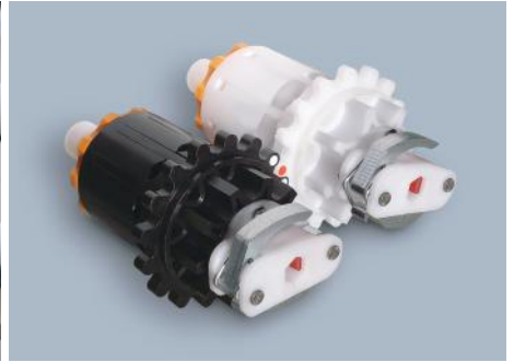
全条繰出ロール(左:播種側、右:施肥側)