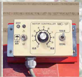
パルス式コントローラ