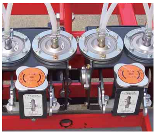
モーター駆動ポンプ/ ダイヤフラム変形防止機構