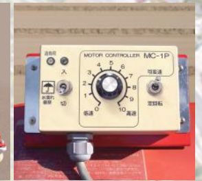
パルス式コントローラ