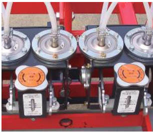
モーター駆動ポンプ/ ダイヤフラム変形防止機構