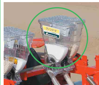
エチルチオメトン粒剤等の散布

⚠️ 安全に関するご注意 ・取扱説明書をご理解の上、正しく安全にお使いください。