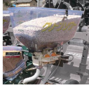
25ℓ 大型肥料ホッパー