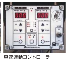
車速連動コントローラ