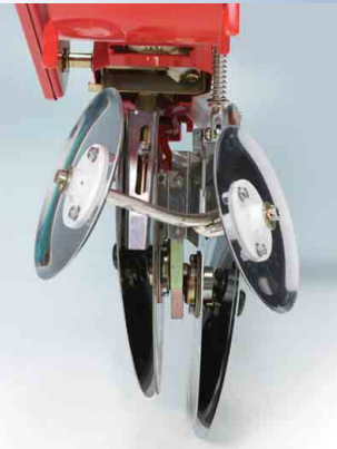
左右ダブルの小型覆土ディスク