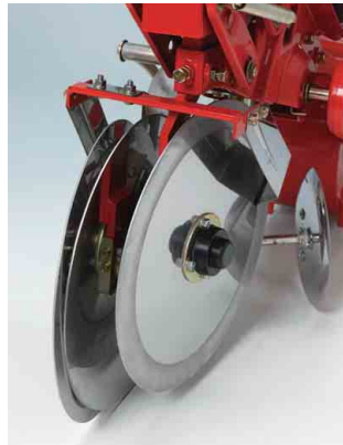
大型ステンレスディスク

[注意] お客様のご希望の目皿が、本体に1点装着されます。2点目からはオプションとなります。