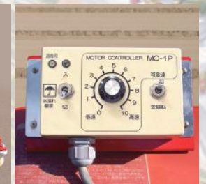
パルス式コントローラ