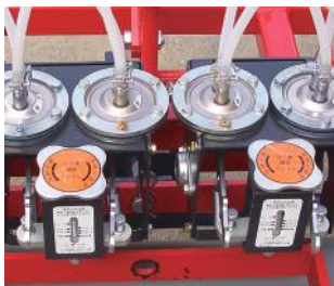
モーター駆動ポンプ/ ダイヤフラム変形防止機構