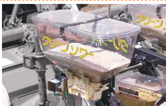
25ℓ 大型肥料ホッパー