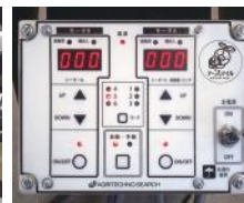
車速連動コントローラ

⚠ 安全に関するご注意 ・取扱説明書をよくお読みの上、正しく安全にお使いください。